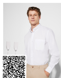
AIFOS L/S CM5504