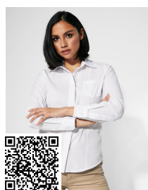
SOFIA L/S CM5161