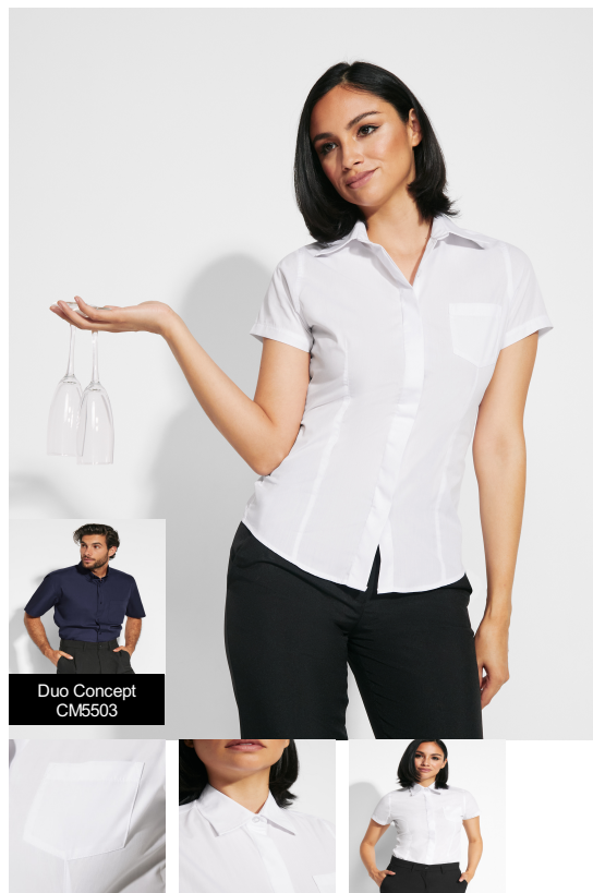
Duo Concept CM5503