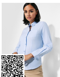
OXFORD WOMAN CM5068