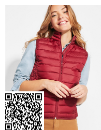
OSLO WOMAN RA5093