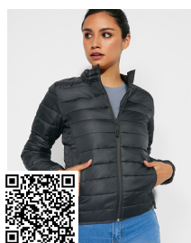
FINLAND WOMAN RA5095