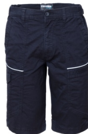
01 - BLEUMARIN