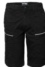
05 - NEGRU