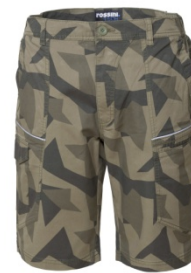
1C - CAMUFLAJ