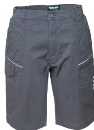
12 - GRI