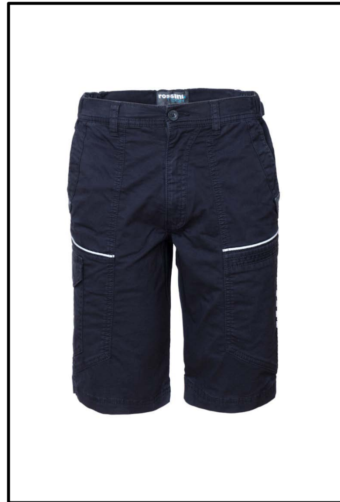
01 - BLEUMARIN